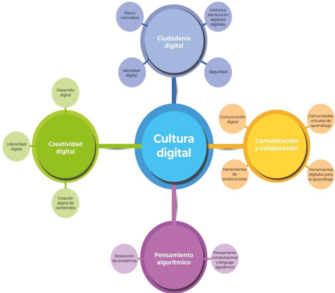
Figura 1. Categorías y subcategorías de Cultura digital